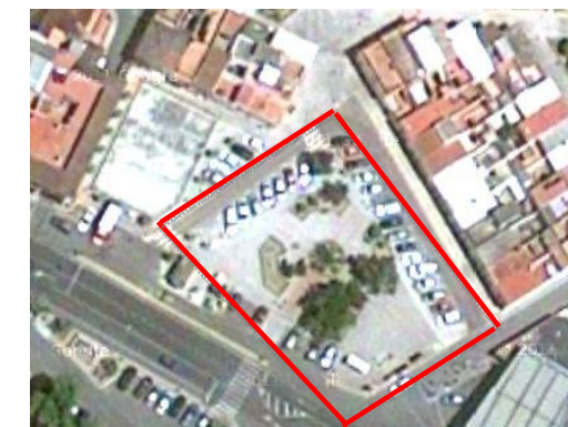
Visual de la zona verde.

Signos de vandalismo en el pavimento, a través de pintadas.