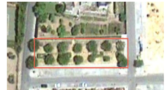
Visual de la zona verde