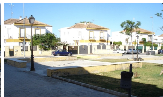
Visual de bancos y arriates