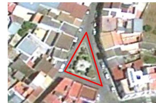
Visual de la Plaza Zambullón.

Las zonas pavimentadas, de solería, se encuentran en mal estado de conservación.