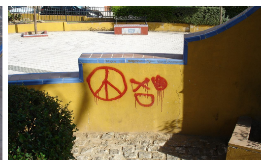
Signos de vandalismo