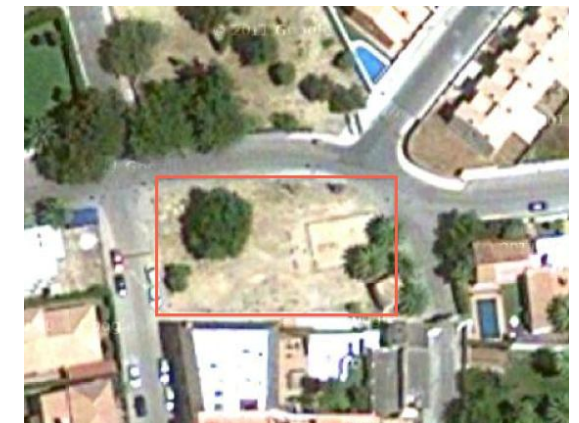
Visual de la zona verde