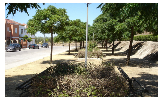
Vegetación seca en arriate