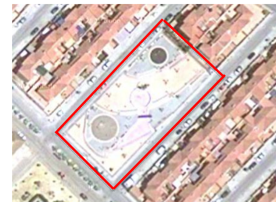
Visual de la Plaza de los Ayuntamientos Democráticos

El pavimento se encuentra en buen estado de conservación.