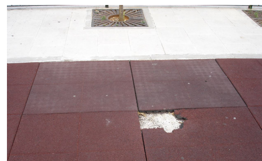
Signos de vandalismo