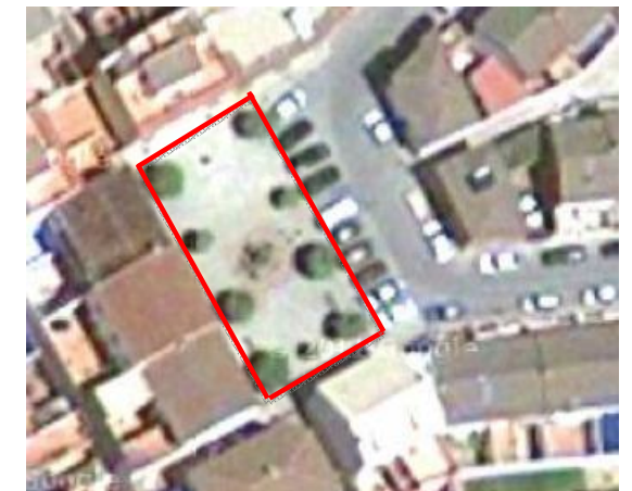
Visual de la plaza.

Las zonas pavimentadas, de solería, se encuentran en buen estado.