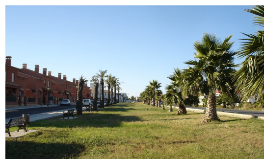
Visual general de la zona verde