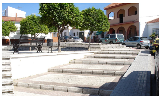
Escalones que unen las diferentes alturas