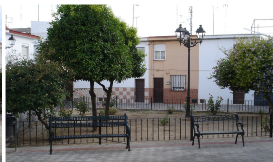
Bancos para sentarse