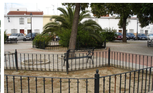
Arriate sin vegetación