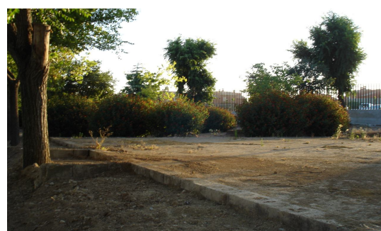
Visual de la zona verde