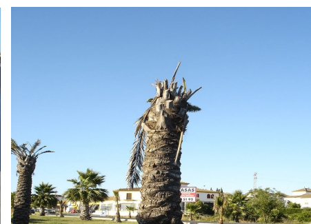
arbolado mal conservado