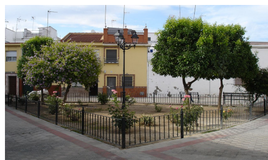
Visual general de la plaza