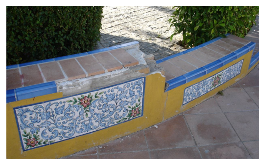
Desperfectos en el mobiliario