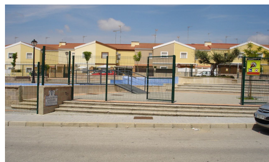
Entrada de acceso a la plaza