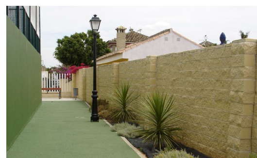
Caminos que lindan con las pistas de pádel