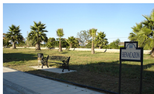
Visual del jardín