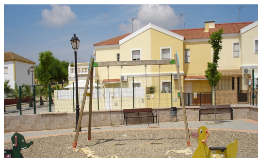
Zona de juegos infantiles