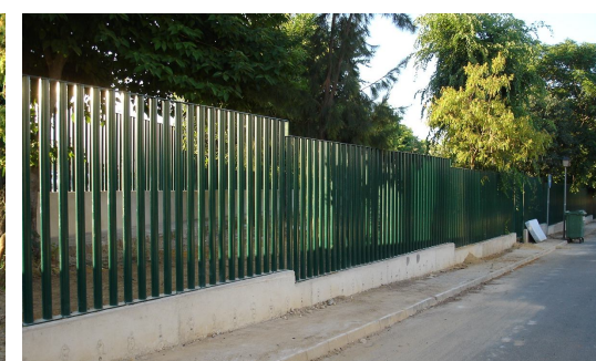
Vallado de la zona verde