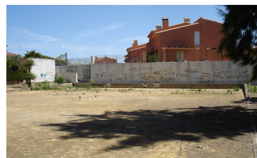
Pista deportiva degradada