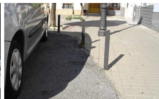
Acceso invadido por vehículos