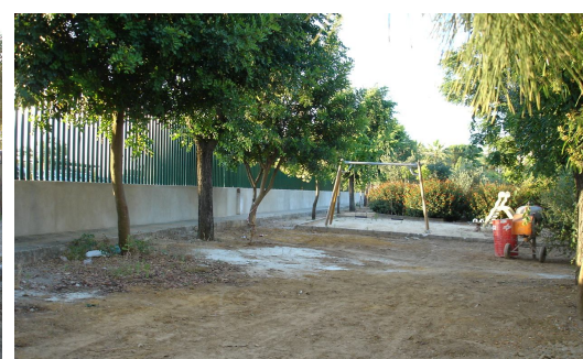
Estado actual de la zona verde