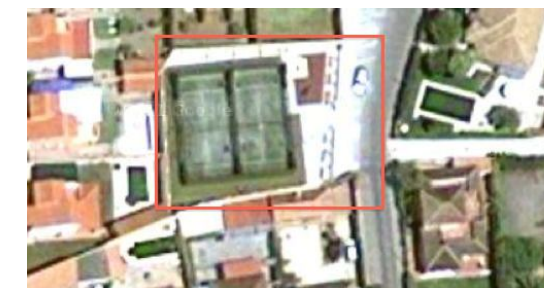
Visual de la zona verde de la Escuela de Pádel

La zona de recepción o descanso es de solería, las zonas infantiles con suelo de caucho continuo y la zona deportiva y las calles lindantes a la misma con suelo homologado para pistas de pádel.