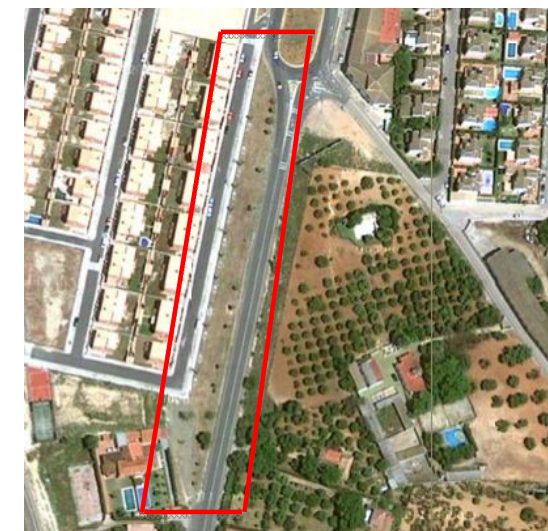
Visual de la zona verde

Las zonas pavimentadas, acerado y zona donde se sitúan los bancos, se encuentra en buen estado de conservación.