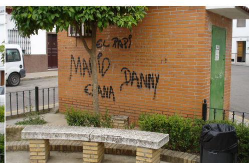
Signos de vandalismo