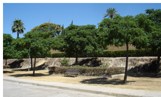
Visual frontal de la zona verde