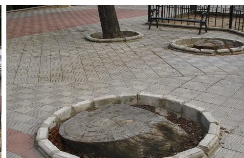
Árboles cortados por la base