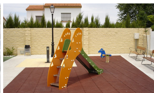
Equipaciones infantiles homologadas