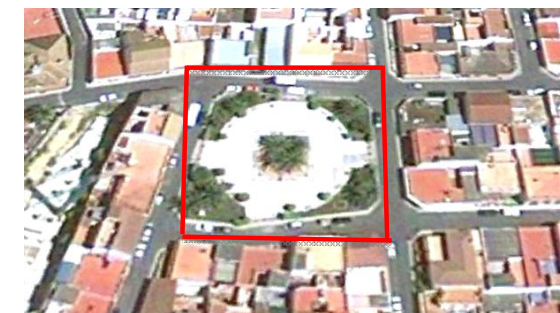
Vista panorámica de la Plaza Santa Teresa.

Todo el espacio está pavimentado con solería, en mal estado de conservación