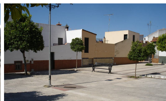
Espacio central, zona de descanso