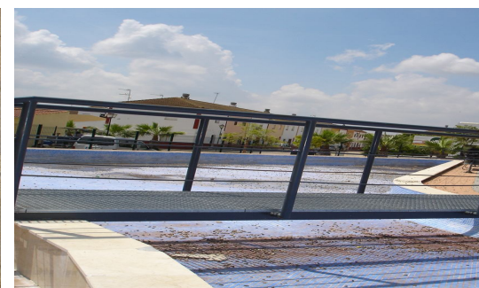
Falta de mantenimiento en fuente ornamental