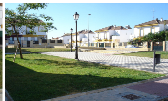
Vegetación de los arriates