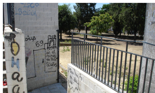
Signos de vandalismo