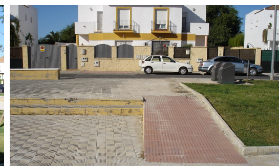
Rampa de acceso que une las dos alturas