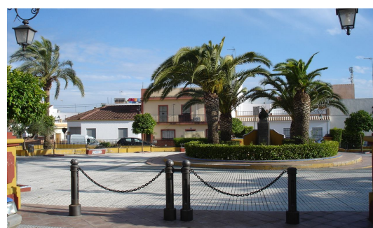
Visual de la Plaza de Santa Teresa