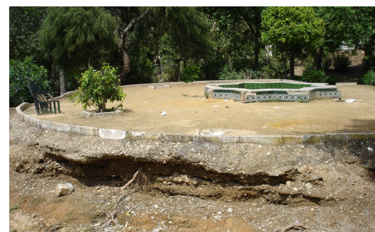
Socavones y degradación del firme