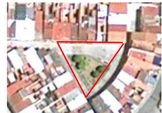
Visual de la Plaza de la Virgen de las Angustias.

El pavimento de la plaza se encuentra en buenas condiciones.