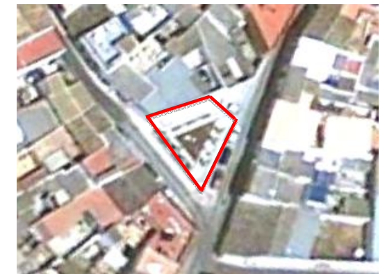
Visual de la plazuela

El caucho de la zona de juegos infantiles se encuentra en mal estado de conservación a causa de actividades vandálicas.