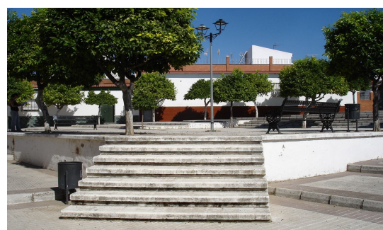
Acceso a zona de descanso