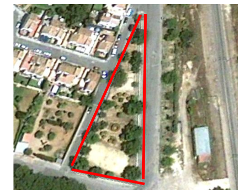
Visual de la zona verde