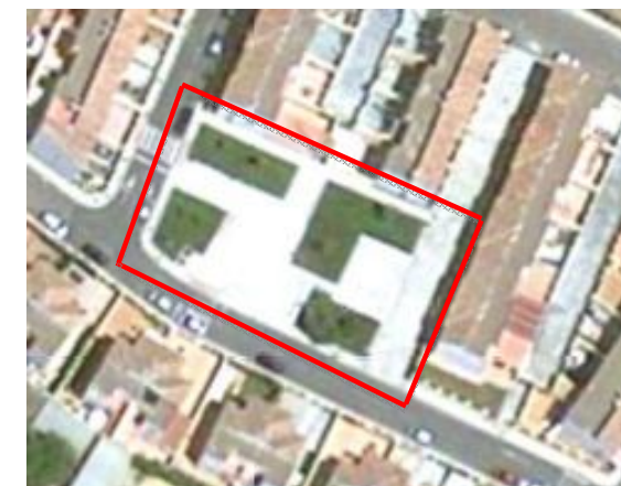
Vista panorámica de la plaza.

Pavimentación en buen estado de conservación.