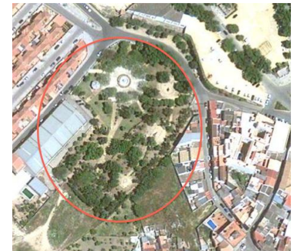
Visual general del parque municipal de las Majarocas.

Riego automático en la zona más cercana a la entrada del parque.