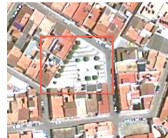
Vista panorámica de la plaza

Todo el espacio está pavimentado, en buen estado de conservación