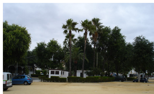
Visual de la zona verde