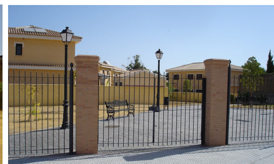
Vallado de la zona verde y puerta de acceso