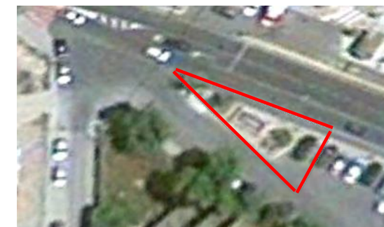
Visual de la Glorieta de la Concordia.