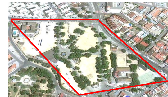
Visual de la zona verde