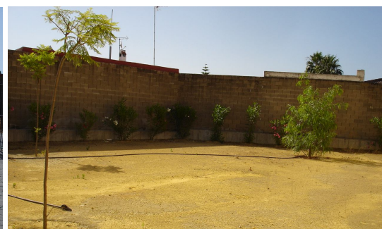
Zona de tierra