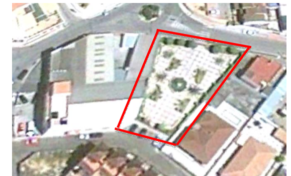
Visual de la Plaza

Todo el espacio está pavimentado con solería, en buen estado de conservación