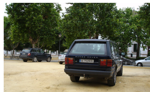
Vehículos invadiendo la zona verde