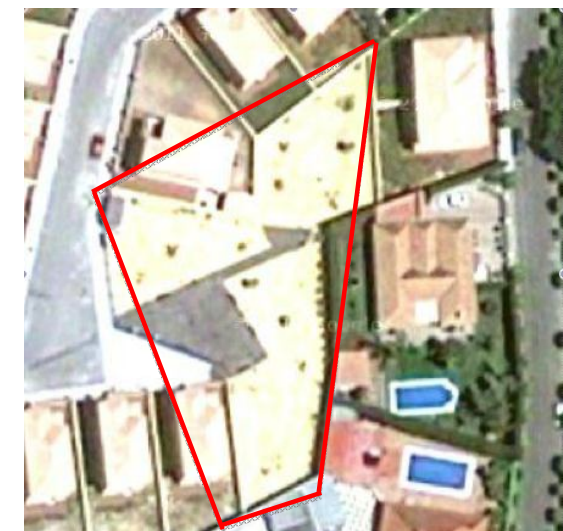
Visual de la zona verde