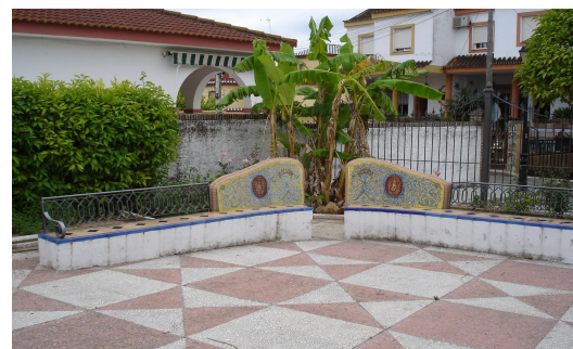
Bancos de cerámica y forja