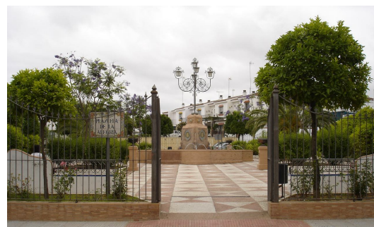
Entrada por C/ de Peteneras