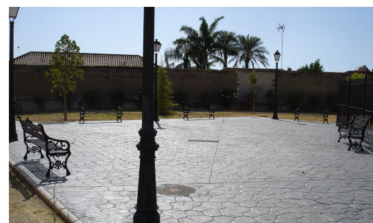
Visual de la zona pavimentada