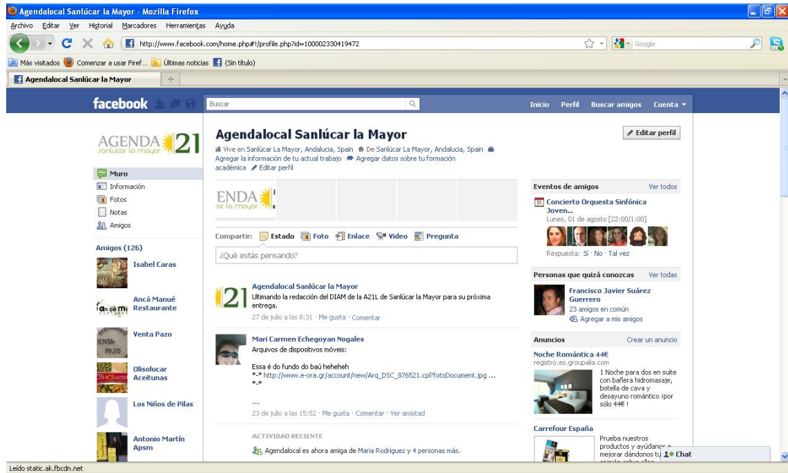
Figura 1: Perfil de facebook de la A21L de Sanlúcar la Mayor.

participación ciudadana, facilitando así la realización del diagnóstico social del proyecto.