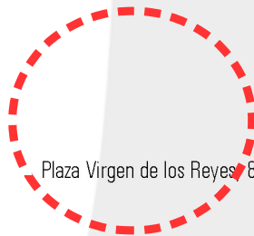
Imagen 6: Fotografía aportada en el escrito de agosto de 2013 la que se indica el lugar de los hechos